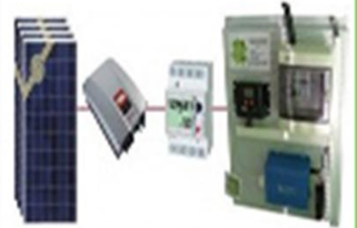
KIT ENERGIA SOLAR AUTOCONSUMO